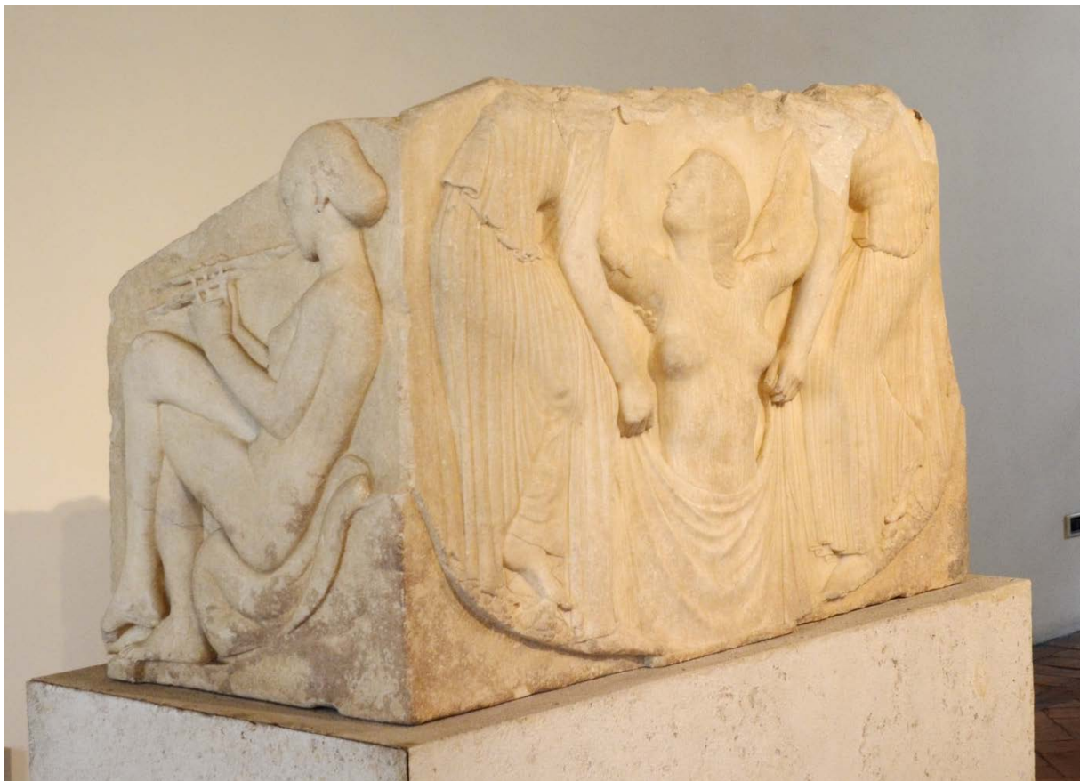
TRONO LUDOVISI. PALACIO ALTEMPS, ROMA

En Grecia la belleza reside en el cuerpo masculino desnudo y la elegancia en el cuerpo femenino vestido.