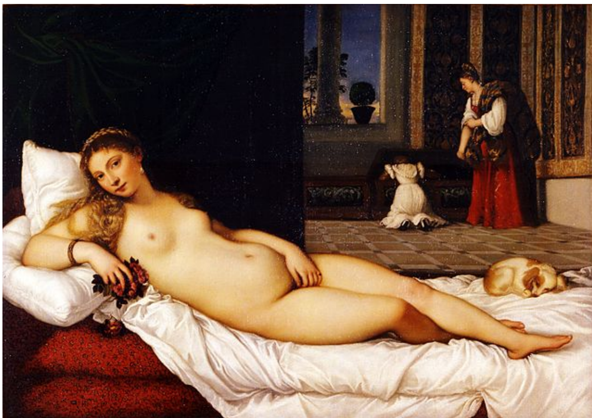
TIZIANO. VENUS DE URBINO. GALERÍA UFFIZI. FLORENCIA

La Venus de Urbino sirvió de inspiración a la Olimpia de Manet .