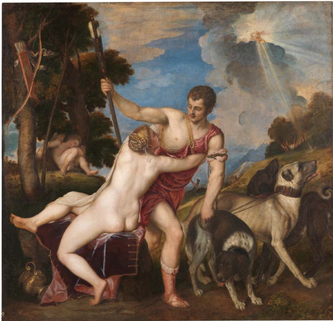
TIZIANO. VENUS Y ADONIS. MUSEO DEL PRADO

Las figuras y las partes principales fueron trasladadas mediante un calco y dicho calco coincide con precisión con el cuadro de Moscú.