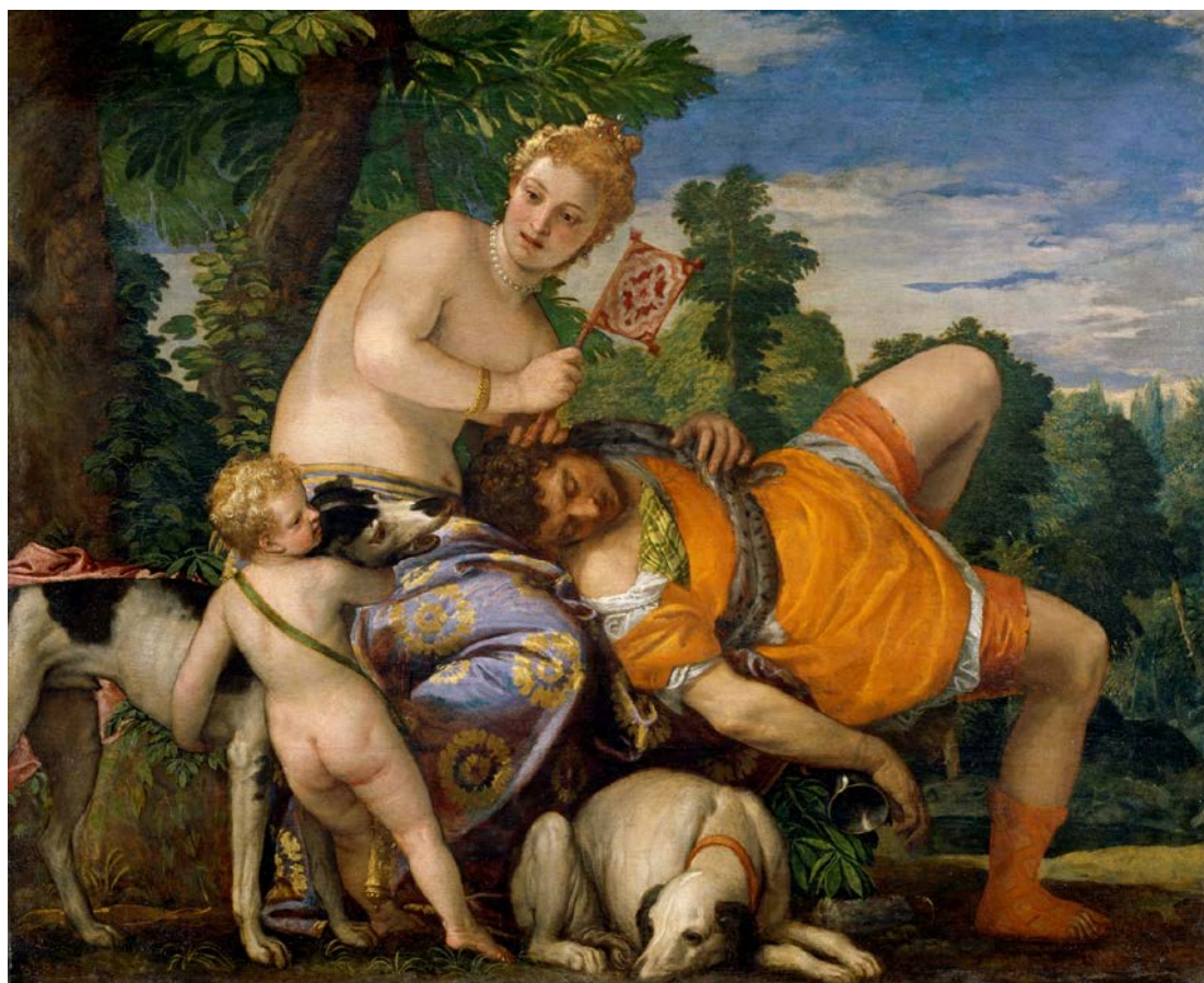
VERONÉS. VENUS Y ADONIS. MUSEO DEL PRADO

Como su pareja, Céfalo y Procris (Museo de Estrasburgo), ilustra un pasaje de Las Metamorfosis del poeta romano Ovidio que cuenta un amor truncado por la muerte repentina de Adonis.