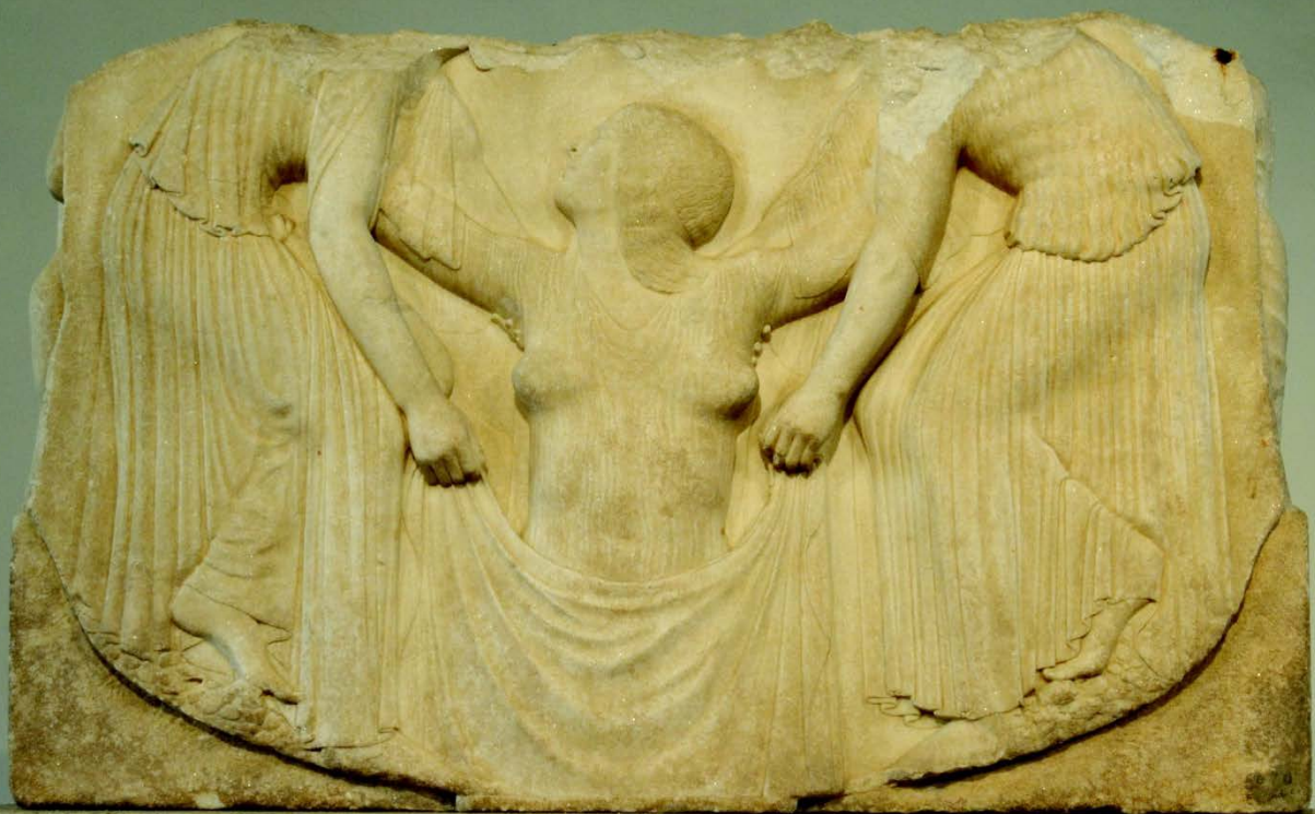
AFRODITA (VENUS) DIOSA DEL AMOR Y DE LA BELLEZA