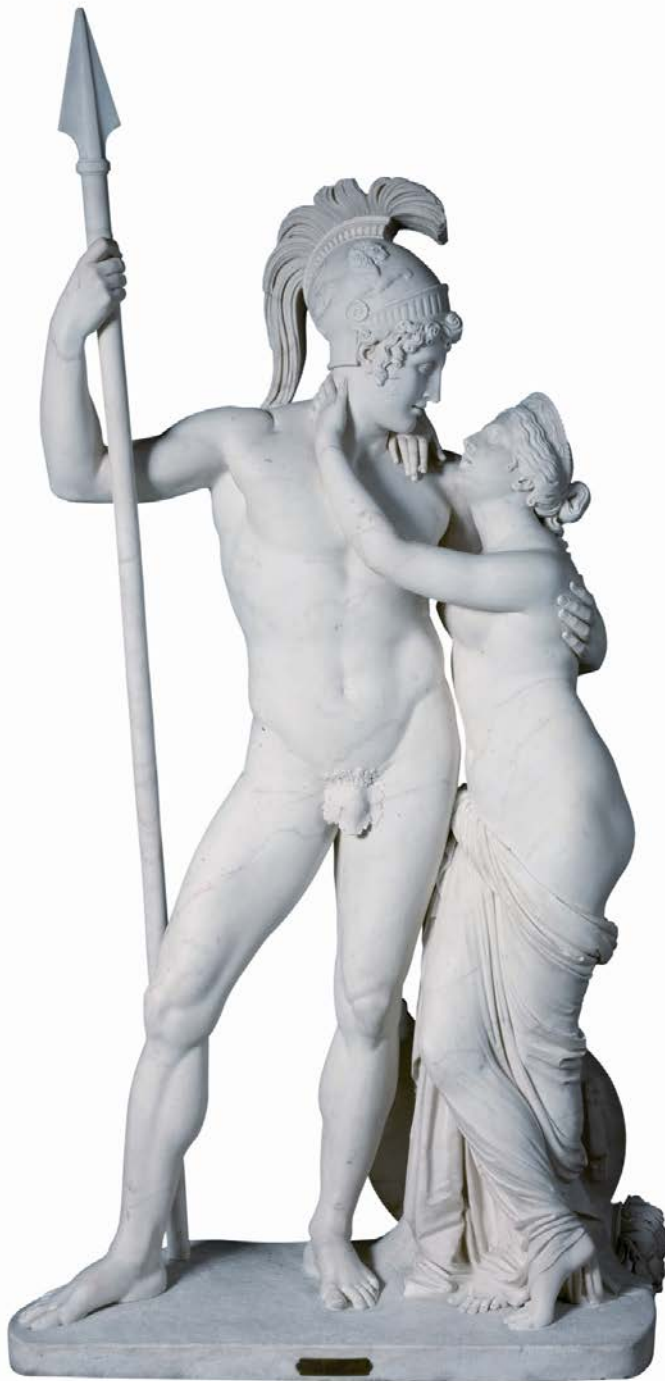
CÍRCULO DE CANOVA. VENUS Y MARTE. MUSEO DEL PRADO

La punta de lanza del ejemplar del Prado recorta sus bordes inferiores, mientras que el modelo británico concluye la punta con formas redondeadas.