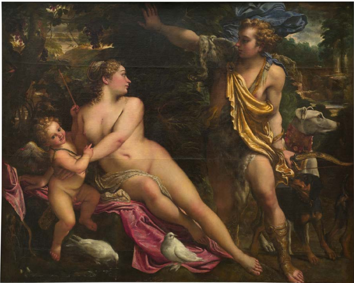
CARRACCI, ANNIBALE. VENUS Y ADONIS. MUSEO DEL PRADO

El paisaje y la luz enlazan con el color veneciano de Tiziano , mientras que el clasicismo de las figuras fue desarrollado por Carracci a partir de la escultura greco-romana y las obras de Correggio, Rafael y Miguel Ángel.