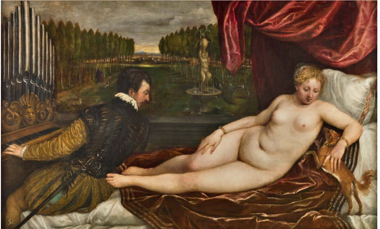
TIZIANO. VENUS RECREÁNDOSE EN LA MÚSICA. MUSEO DEL PRADO

Las pinturas de Venus y la música han sido objeto de interpretaciones dispares, si para algunos historiadores son obras eróticas carentes de un significado más profundo, para Panofsky posee un alto valor simbólico, entendiendo la vista y el oído como instrumentos de conocimiento de la belleza .